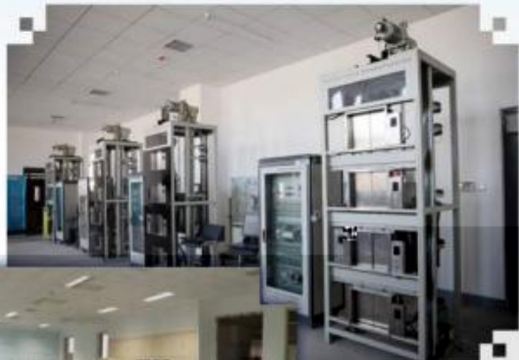
智能电梯安装调试 维护训练场所