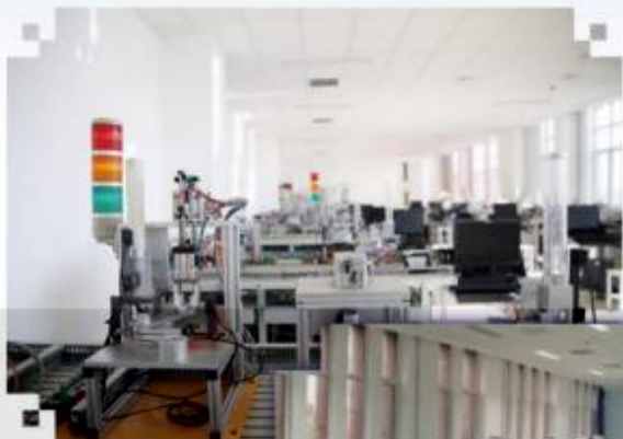
自动化生产线安装与 调试训练场所