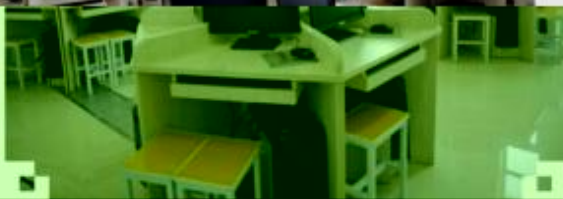
一体化课程教学设计 综合实训室