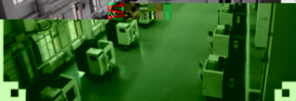
DMG 数控技术 训练场所